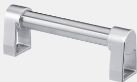
Gegenriff ohne Schaltelemente. Counter handle without switching elements.

Ausführung mit Anschlussleitung, anderer Schaltfunktion oder anderen Griffängen auf Anfrage.